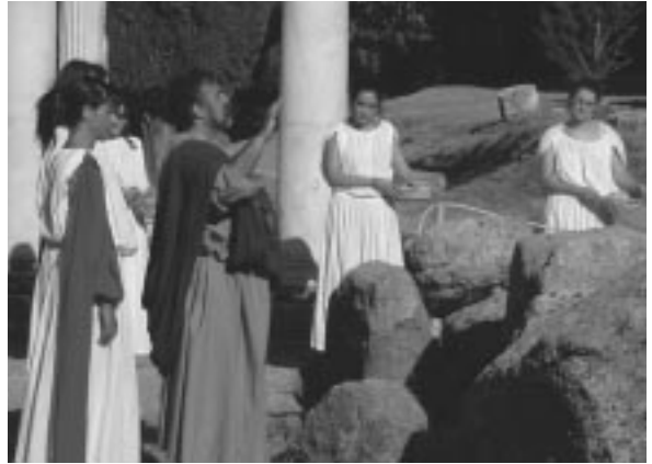
La lettura del giuramento di Ippocrate nell'Asklepeion (Isola di Kos), il più antico ospedale della storia.

Sempre considerando i dati standardizzati per età, la mortalità per tumori è diminuita